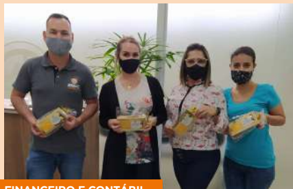
FINANCEIRO E CONTÁBIL