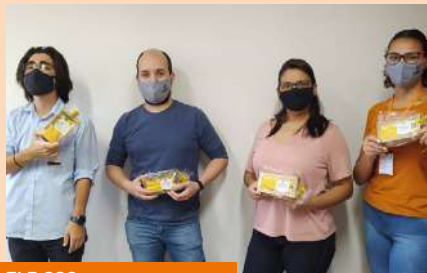
TI E CCO