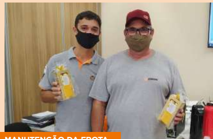
MANUTENÇÃO DA FROTA